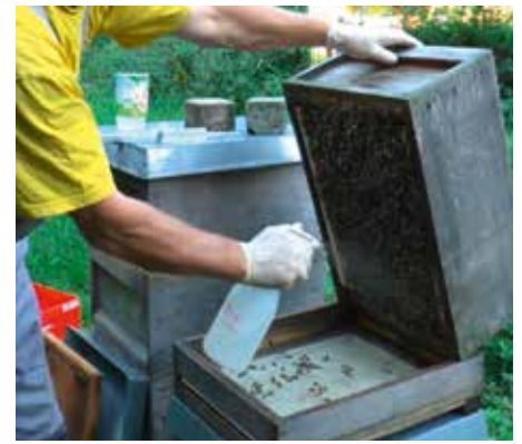
Abb.5 und 6: 21 Tage nach Volksteilung ist der oben aufsitzende Brutling brutfrei. Alle unerwünschten Waben können nun entnommen werden – bei uns stets die 10 unteren, älteren. Die Bienen in den Brutling schütteln.