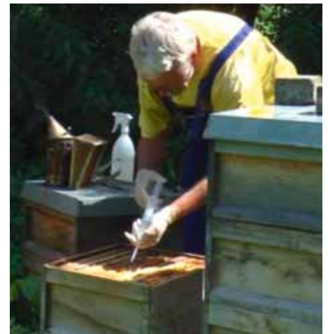
Abb.4: ...und der darunter positionierte Flugling mit Oxalsäure behandelt. Tipp: besser als träufeln wirkt sprühen.

Im Flugling ist außer Winterfuttergaben nichts zu tun. Er hat 21 Tage nach der Teilung über die Hälfte seiner Bienen verloren. Sein Brutumfang ist von seiner Bienezahl und von dem Zeitpunkt der Volksteilung abhängig. Wurde die Volksteilung gegen Mitte Juli durchgeführt, hat der Flugling jetzt, kurz vor dem Schlupf der ersten Brut, etwa doppelt so viele Brutzellen wie Bienen. Wurde erst Anfang August geteilt, hat der Flugling drei Wochen später nur etwa so viele Brutzellen wie Bienen.