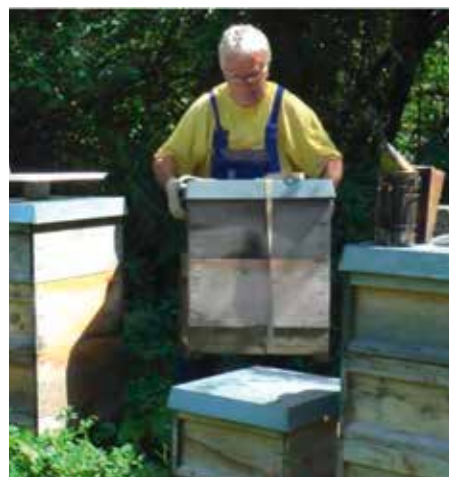
Abb.3: 2 Tage nach der Teilung des Wirtschaftsvolkes wird der hier oben auf geparkte Brutling abgehoben...

Jetzt ist der Brutling brutfrei. Die bei der Volksteilung darin verbliebenen Bienen sind zum größten Teil abgegangen. Allerdings sind bei anfänglich moderatem Varroabefall inzwischen