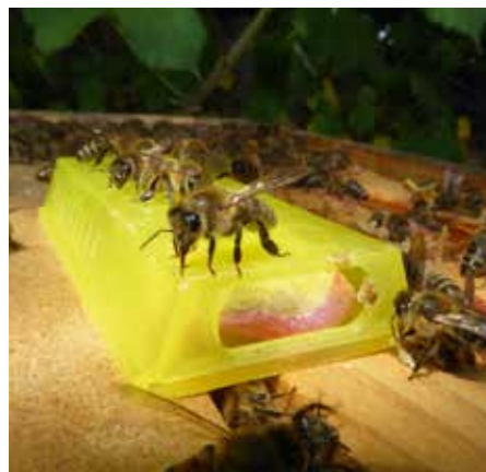
Abb.1 a-b: Die Altkönigin, sie ist im Juli/August meist im oberen Brutraum, wird gesucht und im Käfig mit Futterteig- oder Marshmallow-Verschluss in den Ex-Honigraum = Flugling gesetzt.