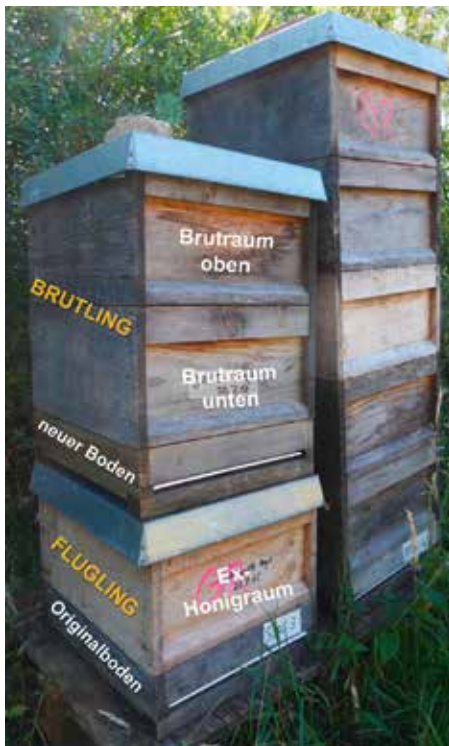
Abb.2: Kurz zuvor aufgeteiltes Volk: unten der weiselrichtige Flugling. Oben der weisellose Brutling. Vorne – auf dem Foto nicht sichtbar – sind beide Fluglöcher auf 2 cm eingengt. Unter den offenen Gitterboden ist von hinten jeweils eine Stockwindel eingeschoben. Denn manchmal sitzen sonst nach dem Teilen des Volkes verwirrte Flugbienen unter dem Gitterboden. Zudem ist so die Räubereigefahr geringer. Darauf ist zu achten, da der Brutling wenige Tage nach Teilung weder über eine Königin noch über ältere Flugbienen verfügt... und somit stark räubereigefährdet ist.

Bei schönem Wetter Flugling bilden. Dazu das Volk auseinandernehmen. Den Honigraum mit innsitzenden Bienen (sie sind noch mit den letzten Putzarbeiten beschäftigt) auf den Boden des Volkes stellen. Sind keinerlei Futterreste mehr im Honigraum (z.B. kristallisierter Honig), dann unbedingt eine Futterwabe einhängen. Am Rand des oberen Brutraumes finden sich meist geeignete, etwa 1-2 kg schwere unbebrütete Waben. Sodann im Brutraum Königin suchen (sie ist meist im oberen Brutraum), unter Marshmallow- oder Futterteigverschluss käfigen und in den Honigraum einhängen (Abb.1a,b). Falls Königin unauffindbar oder Bienen so böse sind, dass man sie nicht suchen will, zunächst in den Flugling eine offene Brutwabe einhängen und am übernächsten Tag gegen Königin tauschen – sie ist im abgeflogenen Brutling