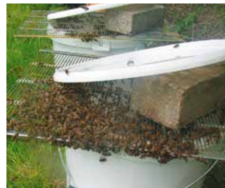
Abb. 3: Schwärme einfangen macht meist Arbeit. Hier ein Singer-Vorschwarm, der gleich mehrere Jungköniginnen enthielt. Daher musste mehrfach eingeschlagen werden. Die Eimer wurden dann mit Absperrgitter, Stein und Deckel in Warteposition im Schatten aufgestellt, bis sich die Trauben in ihnen gesammelt hatten.

Wie angesichts dieses Wissens neue Strömungen wie „free the bees“ oder Imkern in Bienenkiste und anderen Varianten des Mobilbaus den Bienenhalter noch ruhig schlafen lassen, ist mir ein Rätsel. Solange sie nicht (wieder) alleine überleben können, sind für mich schwarmträge Bienen „in“. Und schwarmvorbeugendes Schröpfen, Drohnenschneiden und wöchentliche Kippkontrolle von Mitte April bis Mitte Juli zur Diagnose der Schwarmlust heilige Pflicht. Für eine erfolgversprechende Durchführung ist Know-how über die Bienenbiologie sinnvoll: Völker schwärmen nur dann, wenn sie eine intakte Altkönigin und mehrere meist frisch verdeckelte Schwarmzellen haben. Alternativ nehmen Singer-Vorschwärme (Altkönigin ist beim ersten Schwarmversuch verloren gegangen) oder Nachschwärme (kurz vorher ging schon ein Schwarm ab) mehrere frisch geschlüpfte unbegattete Jungköniginnen mit. Wer also alle 7 Tage kontrolliert und ALLE Schwarmzellen bricht, verhindert jeden Schwarmabgang. Nur wenn ich schlampe (Kontrolle erst an Tag 8 morgens, wenn der Schwarm schon für die Reise gepackt hat), entkommt mir mal ein Schwarm. Wie fängt