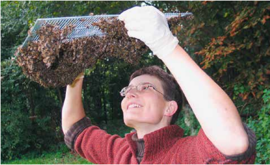
Abb. 4: Hat man die Königin(nen) erwischt, hängt sich der Schwarm unter dem Absperrgitter im Eimer neu auf.

man diesen – oder fremde – nun aber ein?