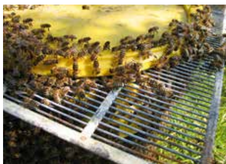
Abb. 6: Sterzelnde Bienen am Eimerrand locken aufgeflogene Bienen mit Duft wieder zur Traube zusammen.

Im Schatten in direkter Nähe des Fangortes aufgestellt, mit einem Absperr-