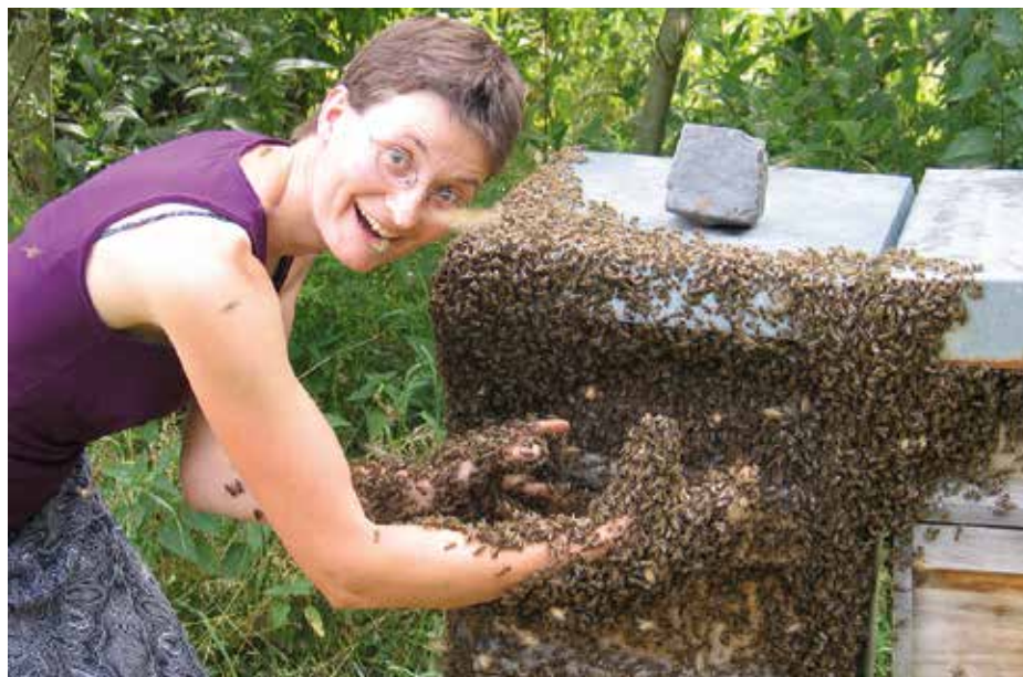
Abb.8: ZU fauler Imker mit mehr Glück als Verstand. Der Schwarm zieht gerade aus. Wer dann die Königin schnappt, erspart sich das „in die Bäume kriechen“.