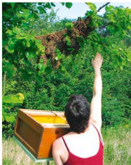
Abb. 2: Ganz Faule schlagen den Schwarm direkt in die Zarge mit untergebundenem Boden ein.

und dies kaum auffällt. Und im zeitigen Frühjahr setzt sich ein früher Schwarm in das „gemachte Nest“ mit fertigen Waben und Futtermitteln. Für permanente Besiedelung gibt es bislang keinen Beleg. Andere behaupten, ihre Schwärme nach dem Abgang immer fangen zu können. Will man nicht von April bis Ende Juni jeden Tag zwischen 10 und 15 Uhr an seinen Völkern wachen, ist das utopisch. Denn Schwarmbienen sammeln sich meist nur für etwa eine Stunde in der Nähe des Muttervolkes, danach sind sie fort. Kommt der Imker abends nach Hause, findet er allenfalls fremde Schwärme in seinem Garten hängend. Denn Bienen suchen zwar „das Weite“, aber offenbar die Nähe anderer Völker. Tierfreundlich wäre es zwar, auch diese fremden Schwärme zu fangen, das habe ich mir jedoch ab-