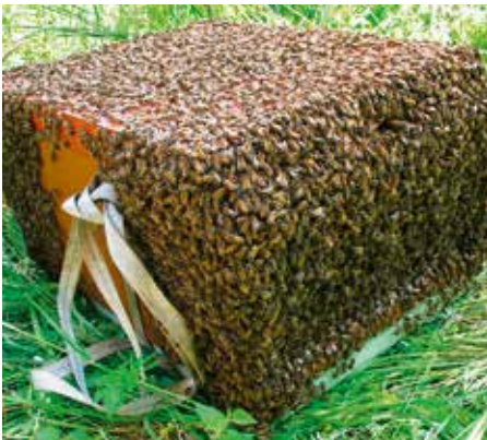
Abb. 5: Statt Eimer gleich ins Magazin einlaufen lassen, die einfachste Variante. Besonders, wenn noch eine Autofahrt ansteht.

Ein 25 kg- (besser 40 kg-) Honigeimer mit Deckel und ein Absperrgitter genügen, um Schwärme zu fangen. Mate-