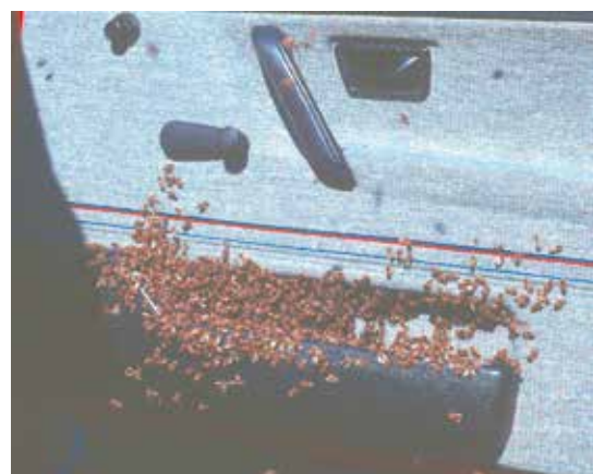
Abb.9: Königinnen locken Schwarmbienen an jeden Ort.

Aber Achtung: die Königin nicht in der Autotür-Seitentasche zwischenparken (Abb.9).