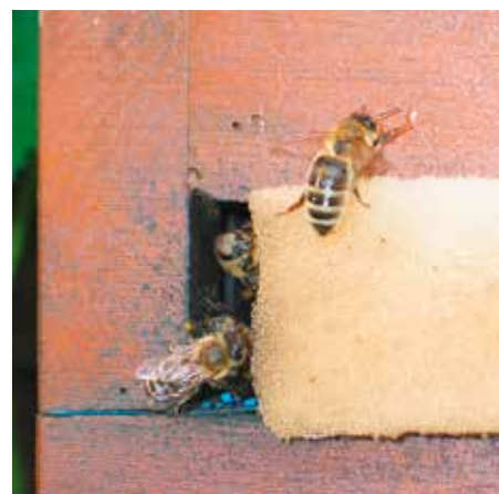
Abb.3: Korrekt eingegengtes Flugloch eines frisch gebildeten Ablegers und danach weiselrichtigen Jungvolkes bis Oktober.