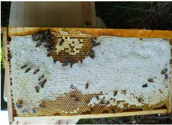
Abb.4: Dieser Jungimkerin wurde geraten, das Jungvolk kontinuierlich mit Futter zu versorgen, um die Bruttätigkeit anzuregen. Resultat: Volk war verloren, da kein Platz zum Brüten.