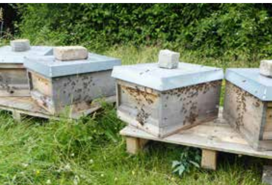
Abb.8: Beste Platznutzung am Stand: 16 frische Ableger auf zwei Paletten.

● Behandeln Sie Jungvölker gegen Varroa erst dann, wenn nötig! Jungvölker sind keine kleinen Wirtschaftsvölker! Sie haben eine vollständig andere Po-