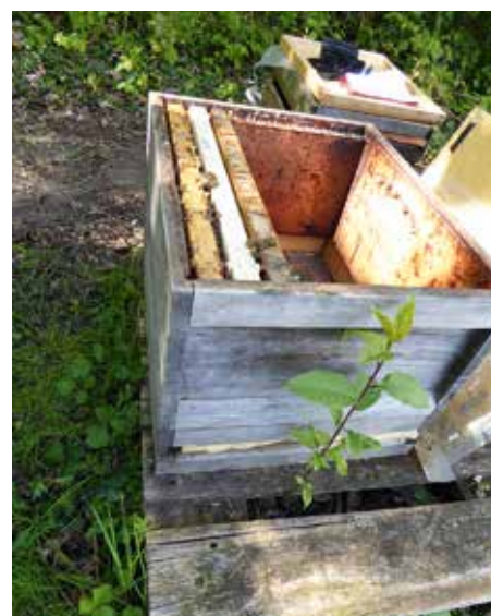
Abb.2: Ableger korrekt einlogiert: die Verteidigung klappt auch bei kühlen Temperaturen, wenn das stark eingegengte Flugloch an einer Zargenseite sitzt. Direkt dahinter an der Kastenwand die leere Ex-Brutwabe (wenn aus Pflegevolk gebildet, siehe DNB April) oder die frisch geschöpfte Brutwabe, gefolgt von einer Mittelwand und der Futterwabe.

nenten Futterstrom, müssen also fortwährend gefüttert werden, um sich zu entwickeln.