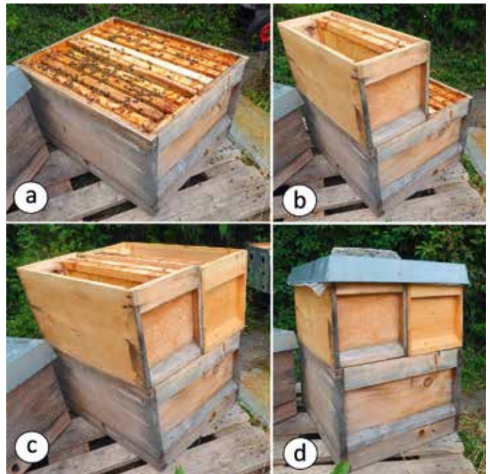
Abb.11: Im Juni bilde ich Jungvölker nur noch, um Jungköniginnen für das spätere Umweiseln der Wirtschaftsvölker zu ziehen. Sie regieren bis Oktober über je eine Doppelhaushälfte (a). Wird es darin zu eng, setze ich mit vertikalen Honig-Halbzargen den zweiten Stock auf (b,c,d). Nach Ernte einer Jungkönigin können beide Volksteile zusammenlaufen, kein Material muss abtransportiert werden.