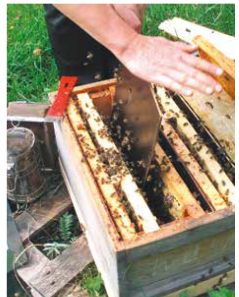
Abb.9: Ist ein Abteil weisellos, einfach Schied ziehen und Bienen samt Waben dem Nachbarn zufügen.

● Zwei bzw. vier Wochen später: Wurden Bienen aus Pflegevölkern mit je einer frisch geschlüpften Königinnen in die Abteile einlogiert, sind die ersten Stifte schon nach 2 Wochen vorhanden. Einfache Brutwabenableger verfügen in der Regel nach 4 Wochen über eine selbst gezogene und begattete Jungkönigin. Jetzt ist der richtige Moment um sie zu suchen und zu zeichnen. Denn im noch kleinen Volk ist sie leicht zu finden. Frischgeschlüpft rannte sie wie irre über die Waben, von ihren Bienen in die Beine gezwickt. Jetzt sitzt sie ruhig und mit inzwischen großem Hinterleib dick und zufrieden mitten im Brutnestbereich. Selbst wenn das Zeichnen nicht ganz sanft erfolgt, nehmen Königin und Bienen es jetzt nicht mehr so übel wie direkt nach dem Schlupf. Selbst verschreckte Königinnen können mit ihrer Körperfülle jetzt nicht mehr wegfliegen, sondern höchstens zu Boden plumpsen. Auch den Markiergeruch nehmen die Hofstaatbienen nun nicht mehr so krumm, schließlich duftet die eier-