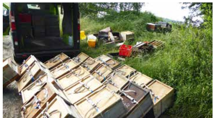
Abb.7: Ein Pflegevolk kann in bis zu 20 sehr kleine Begattungsableger aufgeteilt werden. Hier wurden gerade fünf Pflegevölker (entstanden aus ursprünglich 50 Brutbrettern) aufgelöst. Jeweils vier Begattungsableger sitzen nun in jeder Zarge auf Viererboden. Nur 21 statt 84 Beuten herumschleppen, das erspart viel Transportarbeit.