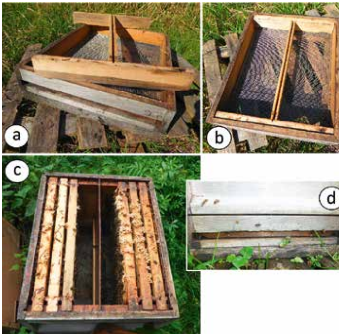
Abb.10: Ein Doppel-T-Stück unterteilt den Gitterboden (a,b). Nun nur noch Zarge aufsetzen und Schied einhängen. Fertig sind zwei Wohneinheiten für Völkchen auf bis zu 5 Waben (c). Das Doppel-T-Stück engt das große Flugloch auf für Jungvölker passgenaue Größe an den Zargenrändern ein (d). So gibt es kaum Verflug und keine Räuberei.