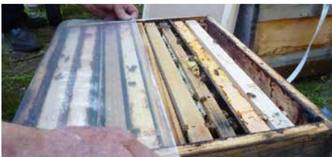
Abb.6: Achtung wilde Weiber! Jedes Abteil wird zunächst mit einer Wabe aus dem Pflegevolk oder einer Brutwabe, sowie einer gefüllten Futterwabe besetzt. Etwa 2000 Bienen sollten auf den Waben sitzen. Sie wurden vor dem Einhängen mit Oxalsäure besprüht. Erst dann die frisch geschlüpften Jungköniginnen einlaufen lassen. Dabei unbedingt darauf achten, dass diese nicht versuchen sich gegenseitig zu massakrieren. Folie hilft.

● Geben Sie Futter nur wenn nötig. Um zu Wachsen benötigen Jungvölker keinen kontinuierlichen Futterstrom.