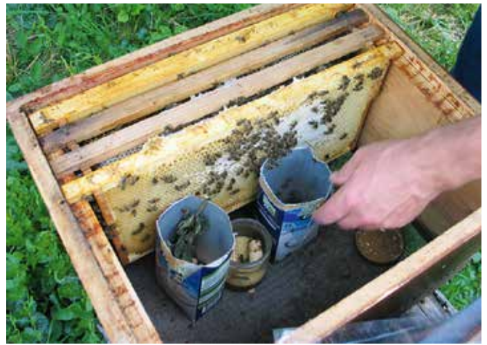
Abb.5: Hier sind bereits zwei Mittelwände ausgebaut, es kann mit einer neuen Mittelwand, einzuschieben VOR der Futterwabe, erweitert werden.

Denn Jungvölker sollen sich zunächst am besten auf engstem Raum entwickeln. Wenn in einer normalen Beute, unbedingt mit Schied und ordentlich symmetrisch mittig.