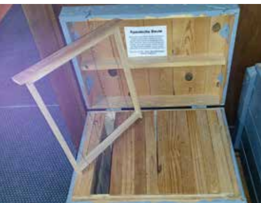
Alte spanische Beute: Die Oberträger stoßen aneinander, um Wärmeverluste nach oben zu vermeiden.

Erweitert wird der Brutraum im Frühjahr immer nur mit ganz, mindestens aber mit halb vollen Futterwaben, und zwar immer links oder rechts am äußersten Rand des Brutkörpers. Eine Mittelwand ist, wenn überhaupt, nur als letzte Wabe vor Beginn der Tracht sinnvoll. Vorher ist sie sogar schädlich, denn solange keine (Entwicklungs-)Tracht eingetragen wird kann eine Mittelwand nicht besiedelt werden. Sie wirkt dann wie ein Hemmschuh in der Entwicklung des Volkes. Das Brutnest darf nie auseinandergerissen werden. Es gibt Imker, die (zu einem späteren Zeitpunkt im Mai) Mittelwände ins Brutnest hängen