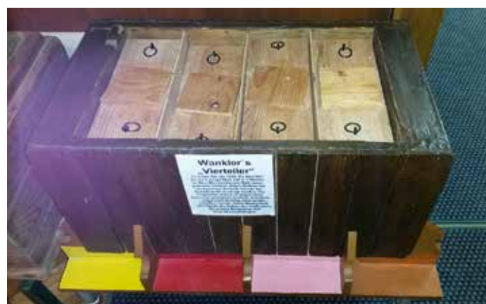
Kleine Überwinterungseinheiten, eng und gut isoliert.