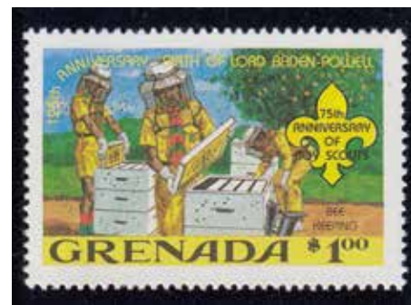
Kalenderblatt Februar 2017

oder Telefon 0 45 51 / 96 75 11 (nur mittwochs!)