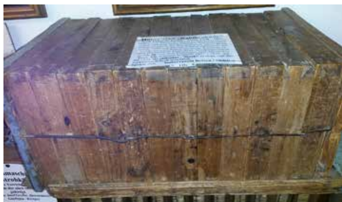
Eine alte Lagerbeute, die scheibchenweise vergrößert werden kann

Nun ist der Zeitpunkt gekommen, wo eine gute Wärmedämmung ausschlaggebend ist für eine rapide Entwicklung des Biens. Spätestens jetzt muss der offene Gitterboden mit einem Brett oder einer Isolie geschlossen werden. Die Schiede, mit denen der Brutraum begrenzt wird, müssen gut isoliert sein. In der Seeberger Styroporbeute kann das Volk auf einer Seite auch an der Außenwand sitzen. In Holzbeuten würde ich unbedingt auch zwischen der äußersten Wabe und der Außenwand ein Thermoschied einsetzen. Sie werden sehen, dass die gute Isolierung der Brutwaben auf beiden Seiten des Brutnestes die Entwicklung weiter beschleunigt. Im Februar sollte die Bienenmasse noch ganz innerhalb des Brutnestbereiches sein. Im Verlauf des März werden viele Bienen schlüpfen, die dann unter Umständen nicht mehr Platz im Brutkorpus haben. Bevor die Waben (es werden zu diesem Zeitpunkt etwa 3-4 Dadant oder 4-6 Deutsch Normal Waben sein) nicht mindestens zu 80 Prozent durchgebrütet sind wird nicht erweitert. Im März dürfen dann auch Bienen jenseits des Schiedes sitzen, von den dort platzierten Futterwaben Futter holen