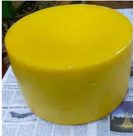
Der fertige, saubere Wachsklotz.

Das Wachs läuft durch den Auslauf der Schmelztonne in einen Eimer. Danach werden die Rohklötze vorgeeignet, gesammelt und in einem elektrischen Schmelztopf (Einwecktopf) mit Wasser geschmolzen, bis das Wachs siedet. Nach dem Erkalten wird der Wachsklotz gereinigt, Trester und Schmutz vom Wachsboden entfernt und noch 2-mal mit Wasser aufgeköcht, und nochmals gereinigt. Das Wachs ist dann sauber. Ich gieße kein flüssiges Wachs durch Strumpfhosen, Sehtücher oder Ähnliches. Das ist mir viel zu aufwändig. Außerdem bleiben immer Wachsreste in den Tüchern zurück. Die Tücher müssen auch erneuert werden.