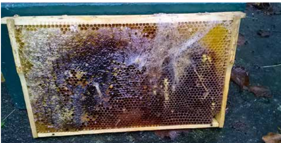
Altwabe mit Wachsmottenbefall, das sollte nicht vorkommen.

Mit dem Fangrohr aus einem Kuhhornstück wurden Bienen von Blüten abgefangen. Nach der Freilassung (ein Stückchen weiter) verfolgte man die Flugrichtung der Bienen. In dieser Richtung wiederholte man das Abfangen und Freilassen bis der Nistplatz gefunden war.