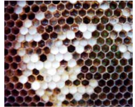
Wer seine Waben mit Essigsäure gegen die Nosemaseuche und Amöbenruhr behandelt, unterbindet gleichzeitig die Pilzentwicklung.

Der zweigeschlechtliche Pilz durchwuchert die Pollenvorräte in den Waben und verwandelt sie in Pflöpfen. Das