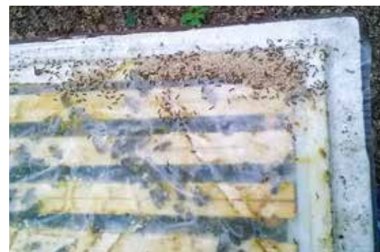
Ameisen fühlen sich in solcher Umgebung wohl.