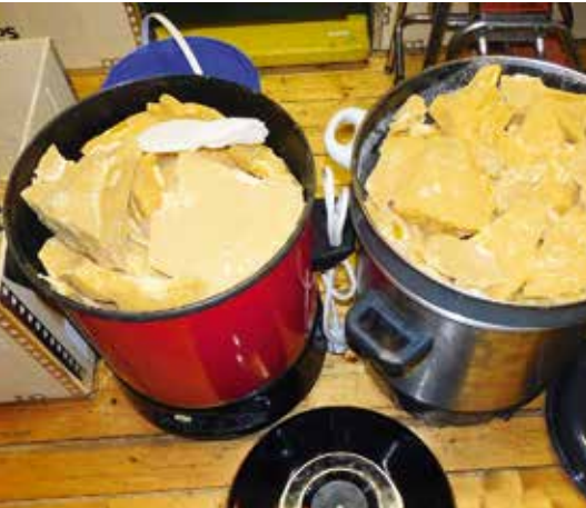
Einkochtopf mit Rohwachs.

Wabenbauerneuerung in der Imkerei sollte 30 bis 50% betragen. Das sind also pro Volk mindestens 0,5 kg Wachs. Das Wachs besteht aus Endecklungswachs, Bauwabenwachs und den Altwaben. Dieser wertvolle Rohstoff muss aufgearbeitet werden, um ihn wieder verwerten zu können.