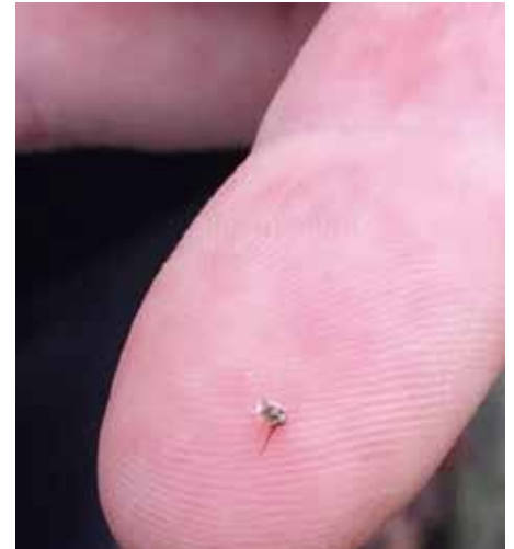
Der erste Bienenstich im Jahr.

Diese Völker werden nicht mit anderen Völkern vereinigt. In diesen Völkern ist nur noch Drohnenbrut und sie haben Drohnenmütterchen (Afterweisel). Solche Völker werden in einiger Entfernung vor dem Nachbarvolk abgefegt.