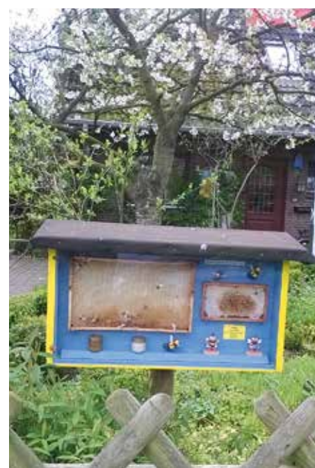
Blickfang am Zaun.

Bei vielen Neuimkern sitzt aber das Geld knapp, also wird doch oft „gebraucht“ gekauft. Damit habe ich auch so meine Erfahrungen gemacht. Es macht vielfach den Eindruck, dass ganze Imkereien aufgekauft werden und diese dann stückchenweise wieder auf den Markt zurückkommen. Spätestens wenn man „gebraucht“ gekauft hat, und seine Beuten zuhause hat, denkt man über Amerikanische Faulbrut und Co. nach. Spätestens jetzt möchte man doch was für die Hygiene tun. Nun beginnen erst die Probleme. Wie reinigt und desinfiziert man die Zargen, jetzt wird man feststellen, dass „günstig“ nicht immer „günstig“ ist, vom Umgang mit Ätznatronlauge einmal ganz zu schweigen. Ein weiteres Problem, welches hinzukommt, ist der Platz. Wo wird der Kocher,