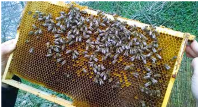
Frisch eingetragener Pollen.

Jetzt werden die Völker einer umfangreichen Kontrolle unterworfen und für die Honigernte vorbereitet. Hier gilt nur so viele Eingriffe wie nötig, aber die sollten konsequent und zügig erfolgen, und das bei höheren Temperaturen und Windstille. Und nicht unbedingt bei den schönsten ersten Bienenflügen (Pollenflügen). Ein Eingriff bewirkt immer einen länger negativen Nachhall im Lebensrhythmus des Bienenvolkes. In dieser Zeit der Volkserneuerung sind Einfühlungsvermögen gefragt. Fehlentscheidungen und falsche Eingriffe bringen Misserfolge.