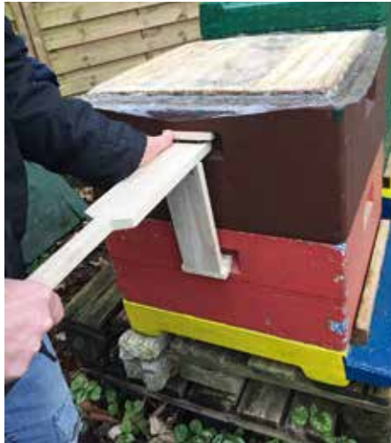
Lösen der Zargen mit dem Beutenknacker.

Das ist der Ablauf der Bearbeitung, das klappt meist, aber doch nicht immer so richtig und zügig. Das liegt aber in der Natur der Sache.