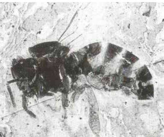
25 Millionen Jahre alter Fund einer Honigbiene aus den Schichten von Rott im Siebengebirge.

Der richtige Umgang mit Honigbienen kann erlernt werden. Anfänger in der Bienenhaltung sollten sich erst einmal schützen, dafür gibt es Schutzkleidung. Dadurch wird anfängliche Angst vermindert und Sicherheit im Umgang mit den Bienen gewonnen. Bei Eingriffen sollte immer die Imkerpfeife oder der Smoker dabei sein. Bei einiger Erfahrung kann als erstes auf die Handschuhe verzichtet werden, später bei zunehmender Vertrautheit mit den Bienen, auch auf den Gesichtsschutz. Das hat den Vorteil, dass ohne Schutzkleidung besser gearbeitet werden kann, besonders an warmen Tagen. Auch behandelt man die Bienen dadurch rücksichtsvoller und mit mehr Einfühlungsvermögen. Sind die Bienen unruhig oder nervös z.B. bei schwülem Wetter oder aus anderen Gründen, werden keine Arbeiten durch-