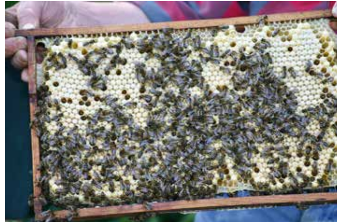
Das kann Ende April bei starken Völkern schon so aussehen, Drohnenwabe.