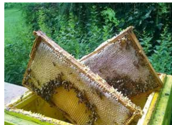
Leerrähmchen im Honigraum werden von den Bienen in Drohnenbau ausgeführt.

Fehlt die Königin entwickeln sich nach einigen Wochen (durch das Fehlen der Königin- Pheromone) die Eierstöcke bei Arbeiterinnen. Es entstehen sogenannte Aftermütterchen, sie legen unbesamte Eier, oft mehrere in eine Zelle.