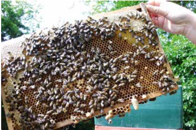
Das kann Ende April bei starken Völkern schon so aussehen, Brutwabe mit Schwarmzelle.