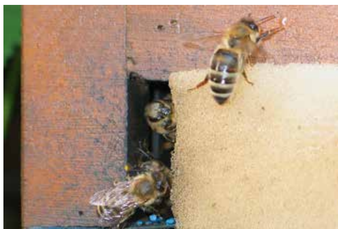
Fluglöcher von Jungvölkern klein halten.

Zwei Wochen später kann ohne große Störung des Jungvolkes zuverlässig beurteilt werden, ob „Alles in Ordnung“ ist. Nach einer weiteren Woche beginnen die Jungvölker zu wachsen, erst langsam und dann immer rascher. Ihre ungestörte Entwicklung wird durch eine ausreichende Futtersversorgung garantiert. Jedes Jungvolk wird mit einer Mittelwand erweitert und neben diese 1-3 mit je 1 Liter Zuckerwasser (3:2) oder Sirup gefüllte Tetrapack eingestellt. Schwimmhilfe nicht vergessen. Bei jedem Nachfüllen (alle 1-2 Wochen) wird eine weitere Mittelwand eingehängt.