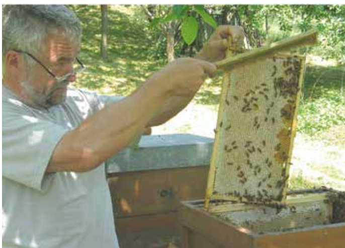
Honigernte mit Besen.

Redaktions- und Anzeigenschluss für die Juli-Ausgabe: ist Freitag, der 5. Juni!