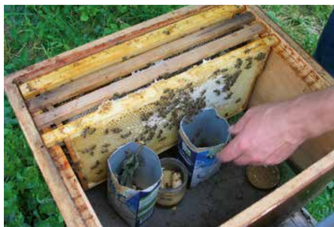
Fütterung mit Tetrapack und Honigglass.