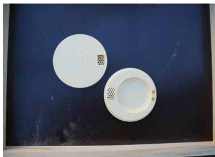
Das Modell von oben (links mit 1 Eingang) und von unten (rechts mit 2 Ausgängen)