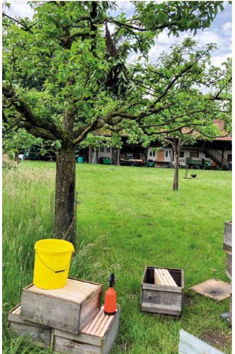
Abb. 3: Der Vorschwarm hängt im Apfelbaum. Darunter mein Treppchen aus Zargen, das mich in Griffhöhe bringt. Wassersprüher für die „Show“, Eimer, Besen und die Beute zum Eilogieren stehen bereit.

Anstatt das Schwärmen der Bienen zu verklären oder gar in die Betriebsweise zu integrieren, plädiere ich für eine effektive Schwarmvorbeugung und -verhinderung. So bleiben das Wohl der Bienen, des Imkers oder der Imkerin gewahrt. Nur im Ausnahmefall fange ich fremde Schwärme ein.