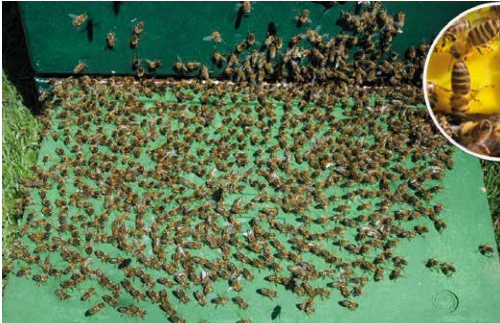
Abb. 5: Sterzelnde Bienen verfädeln einen zitronigen Duft. So weisen sie ihren Schwarmkolleginnen den Weg zur Königin

Singervorschwarm oder Nachschwarm –, und nur eine wurde erwischt. Oder der Schwarm ist schon fast verhungert. Oder der Schwarmfangeimer/die Beute stand in praller Sonne. Oft sind aber die Bienen zu Ast und Königin zurückgekehrt und der Schwarmfänger oder die Schwarmfängerin bekommt eine zweite Chance. Doch Achtung: Nach mehrmaligem Einschlagen sind Schwarmbienen ebenso übellaunig, wie nach einem tagelangen Aufenthalt an der frischen Luft. Dann sollte man besser die Finger weglassen.