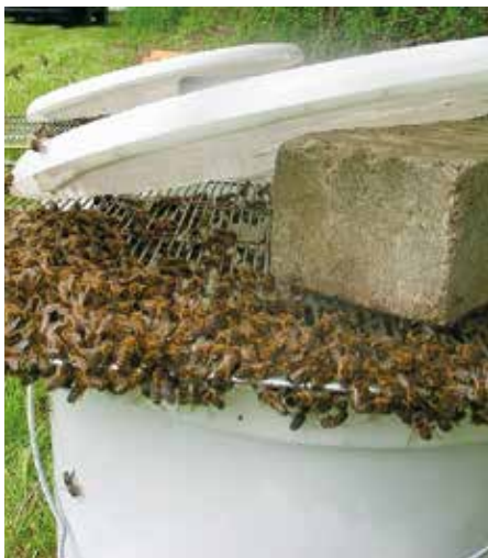
Abb. 6: Hast Du keine Beute dabei, stell den Eimer unter den Baum in den Schatten. Lege ein Absperrgitter auf. Geh einen Kaffee trinken.

Freiwillig zurück in ihre alte Behausung kommen Schwarmbienen nach etwa 30 Minuten, wenn ihre Königin mit beschnittenem oder durch Alter zerfransten Flügel beim Schwarmabgang im Gras verloren ging. Die Schwarmzellen weiterhin, begleiten sie die erstgeschlüpften jungen Königinnen jedoch schon eine Woche später in einem noch viel stärkeren Singervorschwarm.