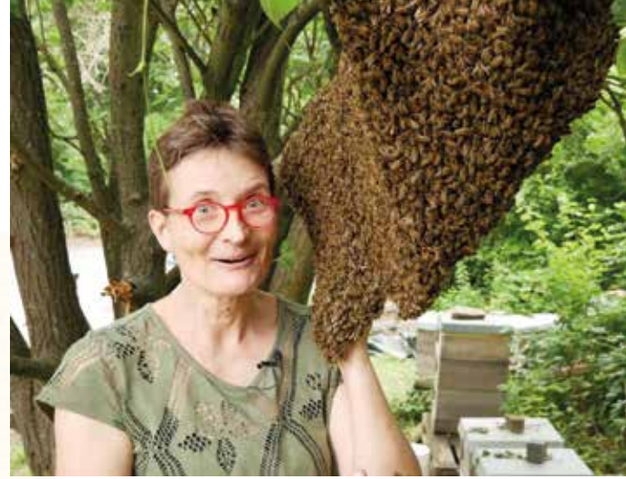
Abb. 1: Die Faszination von Bienenschwärmen muss man mal erlebt haben. Ohne Schwärme ist das Leben für Bienen, Imker und Imkerinnen jedoch viel sicherer.