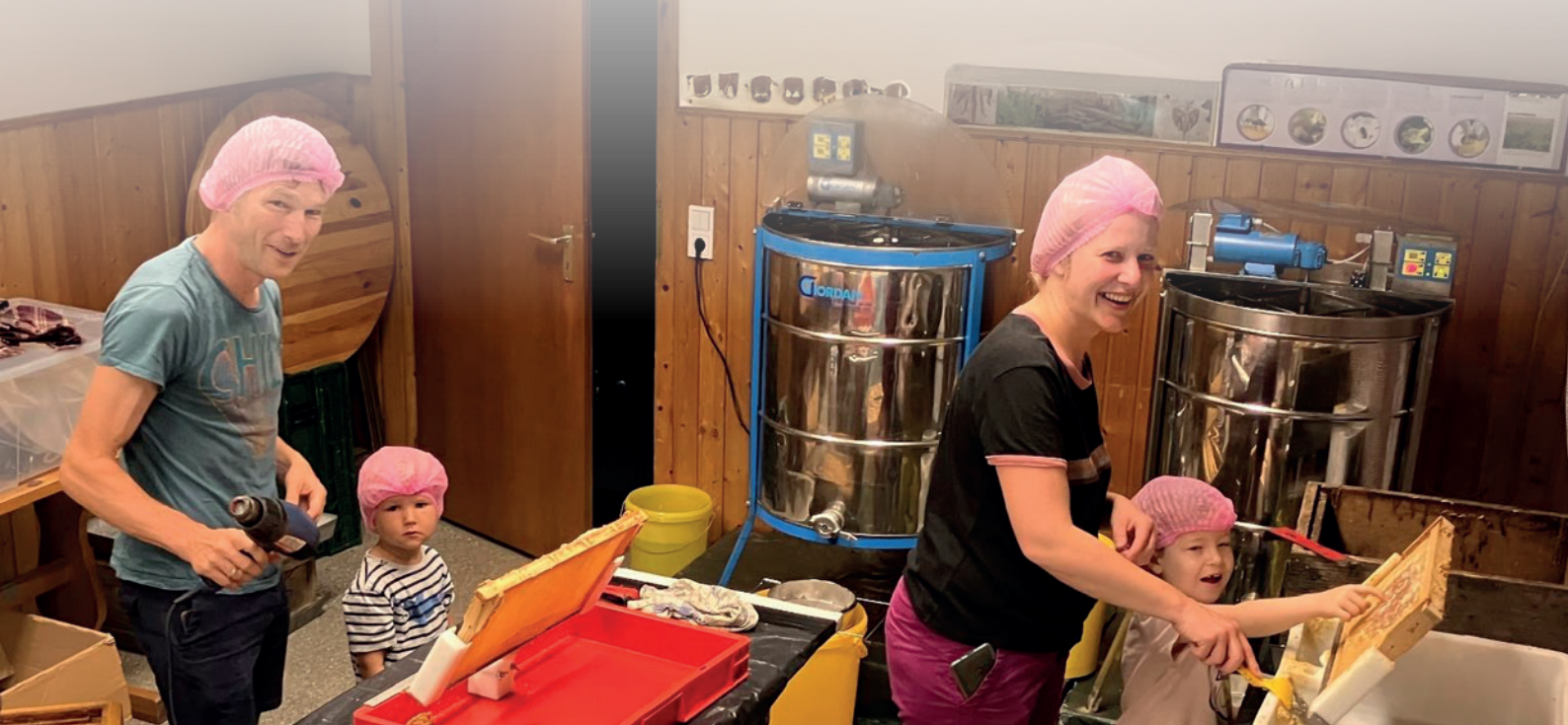
Abb 3: Zwei Entdeckelungs-Stationen und zwei Schleudern...so klappt die Schleuderparty besonders einfach für Betreuende und Schleudernde.