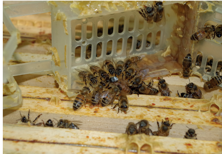
Die befreite Königin wird begeistert empfangen