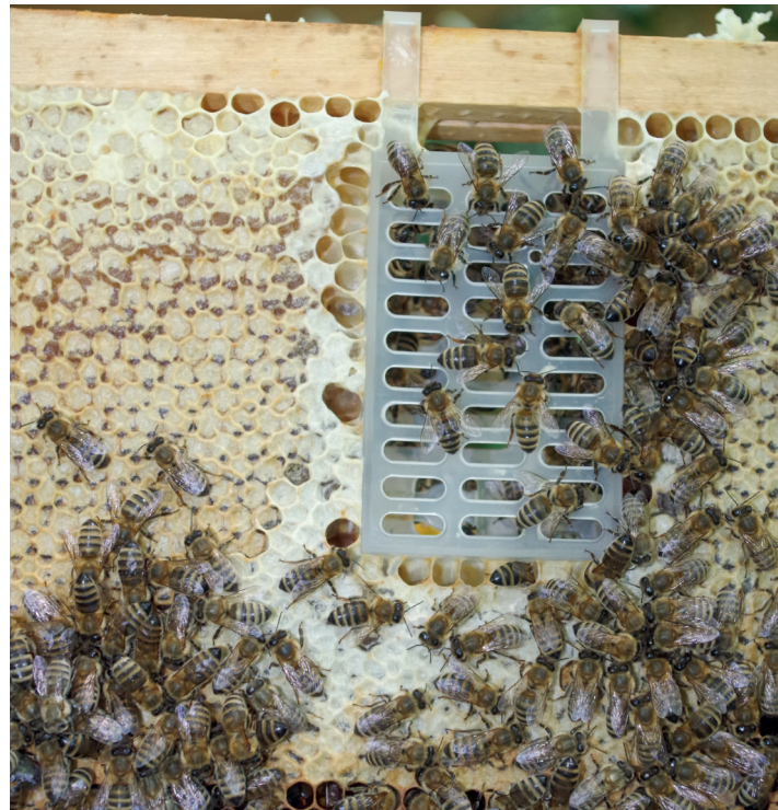
In dem inzwischen gut eingebauten Käfig wartet die Königin auf Ihren Einsatz

Wenn ich eine Wabe mit ganzflächig junger, offener und wenig bis gar keiner verdeckelter Brut finde, wird diese zur „Fangwabe“ – diese hänge ich gerne