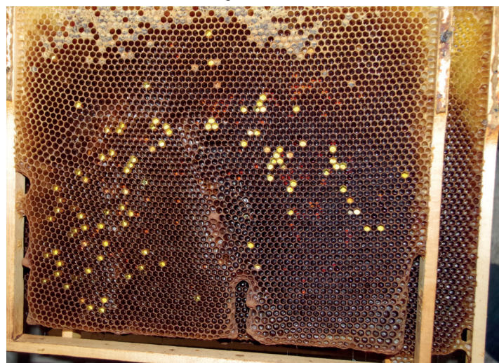
Die ausgelaufenen Brutwaben sind, bis auf wenig Futter und Pollen, leer und können eingeschmolzen werden.

Damit es für die Oxalsäureanwendung keine Hindernisse gibt, gibt es natürlich keinen Honigraum mehr – diese können auf unbehandelten Nachbarvölkern oder dem Brutling einen neuen Platz finden. Zudem hänge ich gerne 1-2 Halbrähmchen voller Honig hinter das Schied, damit die Bienen, auch bei einem Wettereinbruch oder unerwarteter Trachtlücke, versorgt sind. Dieser Schritt ist nur erforderlich wenn die Fangwabe keine dicken Futterkränze als Vorrat aufweist, Zuletzt wird die Königin auf die Oberträger gesetzt; idealerweise dort, wo die Fangwabe sitzt – diese Altwabe