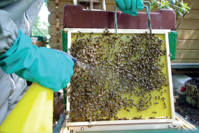
Sprühen des Fluglings mit Oxalsäure – die Mittelwände sind schon gut ausgebaut.

ist ihr meist sympathischer als die nackten Mittelwände. Die Beute bleibt an Ort und Stelle, sodass die Flugbienen diesen Flugling weiter versorgen.