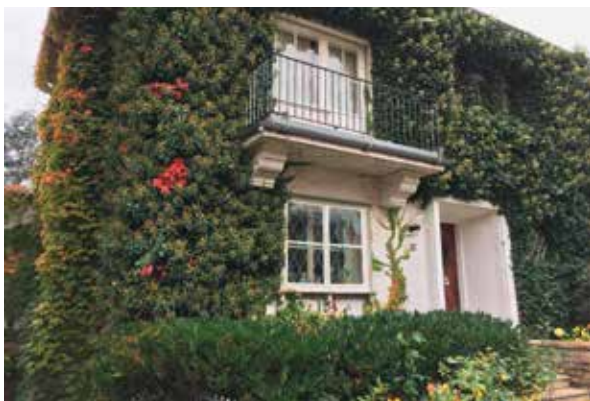
Abb. 5: Wo wilder Wein und Efeu wuchern dürfen, profitiert das Kleinklima und spät im Jahr noch die hungrige Insekten- und Vogelwelt inklusive spezialisierter Arten wie die Efeuseidenbiene. Das kann kein fremdländischer Bienenbaum!