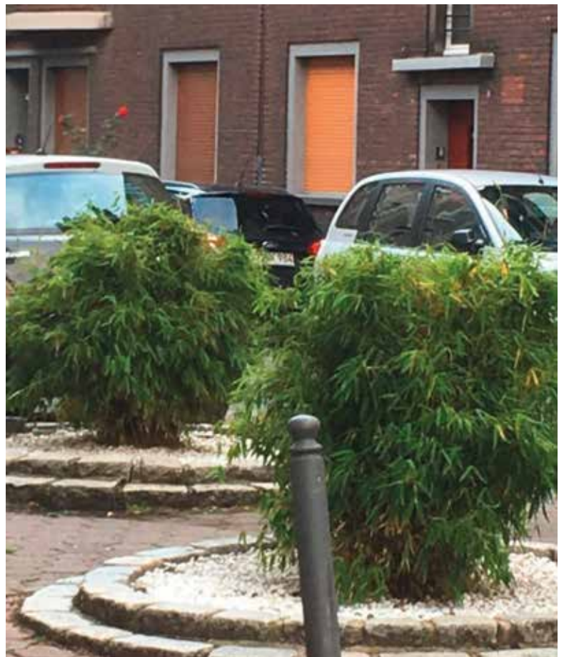
Abb.1: Hier herrscht Ordnung: Folie, Schotter, fremdländischer Bambus rein. Ein Werk der Stadtgärtnerei Bochum

Insektenschutz ist aktuell in aller Munde. Wir Imker können mithelfen, dauerhaft blühende Oasen für die heimische Insektenwelt zu schaffen.