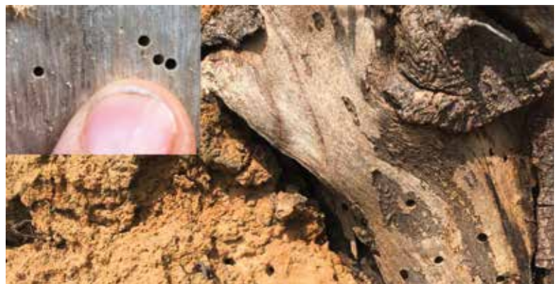
Abb. 6: Unordnung schafft Lebensraum – die Wurzel eines umgestürzten Baums samt herausgerissenem Erdboden enthalten schon nach einem Jahr Liegezeit zahlreichen Insektenwohnungen.