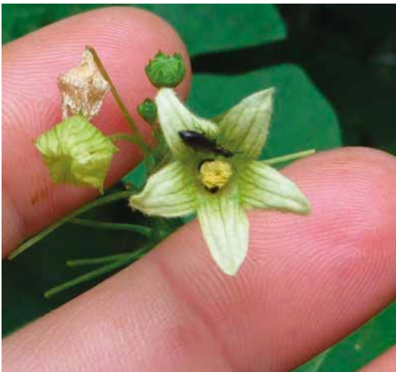
Abb.3: 58 gefährdete Wildbienenarten sammeln Pollen ausschließlich auf einer Pflanzenart. Die Zaunrübe kommt in wilden Gärten ganz von alleine. Sie ist kein „Unkraut“, sondern Lebensgrundlage für die solitär lebende und daher unauffällige Zaunrübensandbiene

Wir Imker können auf privaten und öffentlichen Flächen viel bewirken. Für den eigenen Garten gilt: einfach machen, am besten mehr Unordnung zulassen! Für öffentliche Flächen gilt: Greifen Sie zum Telefonhörer, und suchen Sie Partner. An Ihre Honigbienen müssen Sie dabei gar nicht denken, denn diese nutzen kurzfristig auftretende Massentrachten und sind darauf spezialisiert, umfangreiche Vorräte anzulegen und so auch anschließende Mangelzeiten zu überstehen. Den im Herbst notwendigen Pollen zur Aufzucht gesunder Winterbienen finden sie immer. Schließlich erleben sie schon seit Jahrmillionen die vermeintliche Trachtlücke zu dieser Jahreszeit.