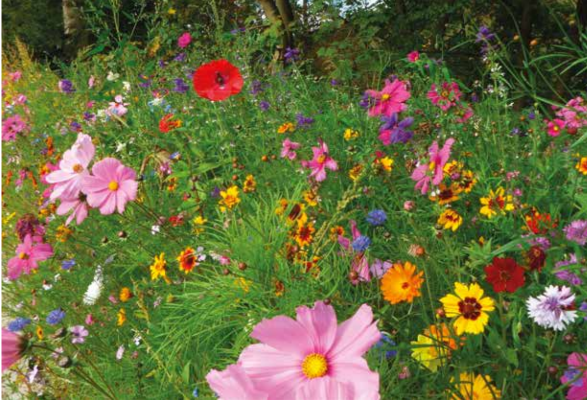
Abb.2: Gartencenter-Aliens sind oft ebenso nutzlos für die heimische Insektenwelt wie die hübsch anzusehenden „Blühweiden“.

Ansiedlungen durch Imker zurück. Neueste angebliche Wunderwaffe gegen die behauptete Trachtlücke: der Bienenbaum. Natürlich wird der von Ubiquisten wie der Honigbiene und wenigen Hummelarten genutzt, aber eben nur von diesen.