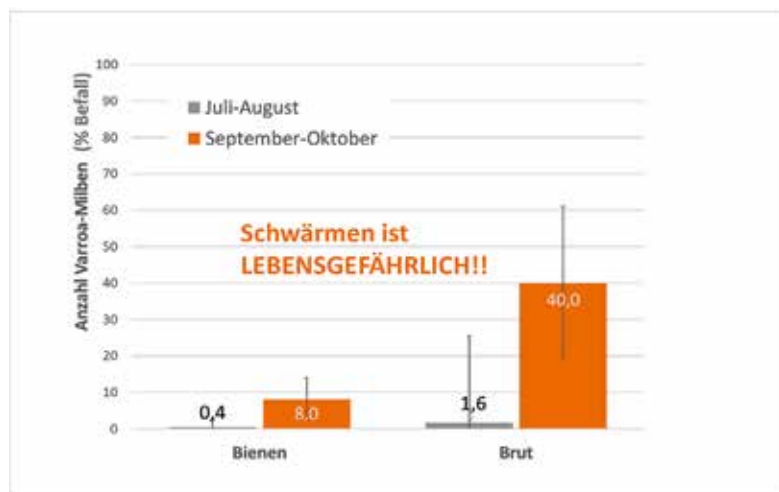
Abb.4: Sobald Winterbienen aufgezogen werden, darf der Varroabefall 10% nicht überschreiten. Alle 42 in Deutschland untersuchten, „wild lebenden“ Völker in Baum- und Felsspalten wiesen im Herbst einen viel zu hohen Varroabefall auf. Keines überlebte den Winter.