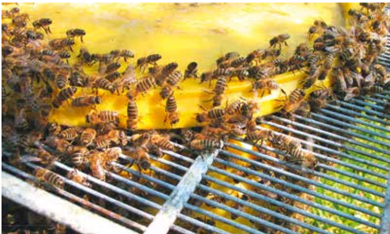
Abb.6: Sterzelnde Bienen am Eimerrand locken aufgeflogene Bienen mit Duft wieder zur Traube zusammen.

Übersieht der Imker die Schwarmzellen weiterhin, begleiten sie die erstgeschlüpften jungen Königinnen jedoch schon eine Woche spä-