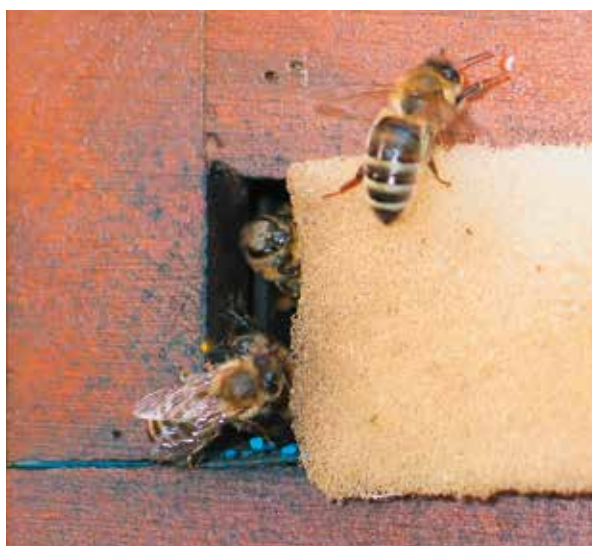
Abb.8. So klein bleibt das Flugloch bis zum Oktober! Dann werden auch die sehr kleinen Jungvölker zwischen Wirtschaftsvölkern nicht beräubert.

4. So schwach gebildete Brutwabenableger sind 12 Tage später zwar um 4000 Bienen stärker (die verdeckelte Brut ist geschlüpft) aber noch weisellos und damit besonders räubereigefährdet. Die Lösung ist eine geschickte Anordnung der Waben: die Brutwabe direkt an die Zargenwand, daneben Mittelwand und Futterwabe. Das winzige Flugloch wird nur direkt unter der Brutwabe geöffnet. Und so auch bei kühlem Wetter bewacht (Abb.8). Mit mittigem Flugloch im hölzernen Fluglochkeil klappt das im Kaltbau nicht! Auch die Art der Fütterung kann Räuberei begünstigen. Ich nutze sicherheitshalber kein Flüssigfutter, sondern eine fertige Futterwabe mit etwa 1,5 kg für die ersten 4 Wochen. Sie wurde vor dem Aufsetzen des Honigraums aus zu gut mit Winterfutter versorgten Wirtschaftsvölkern geerntet und kühl gelagert. Notfalls spendie-