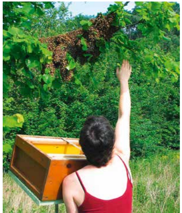
Abb.5: Ganz Faule schlagen den Schwarm direkt in die Zarge mit untergebundenem Boden ein.