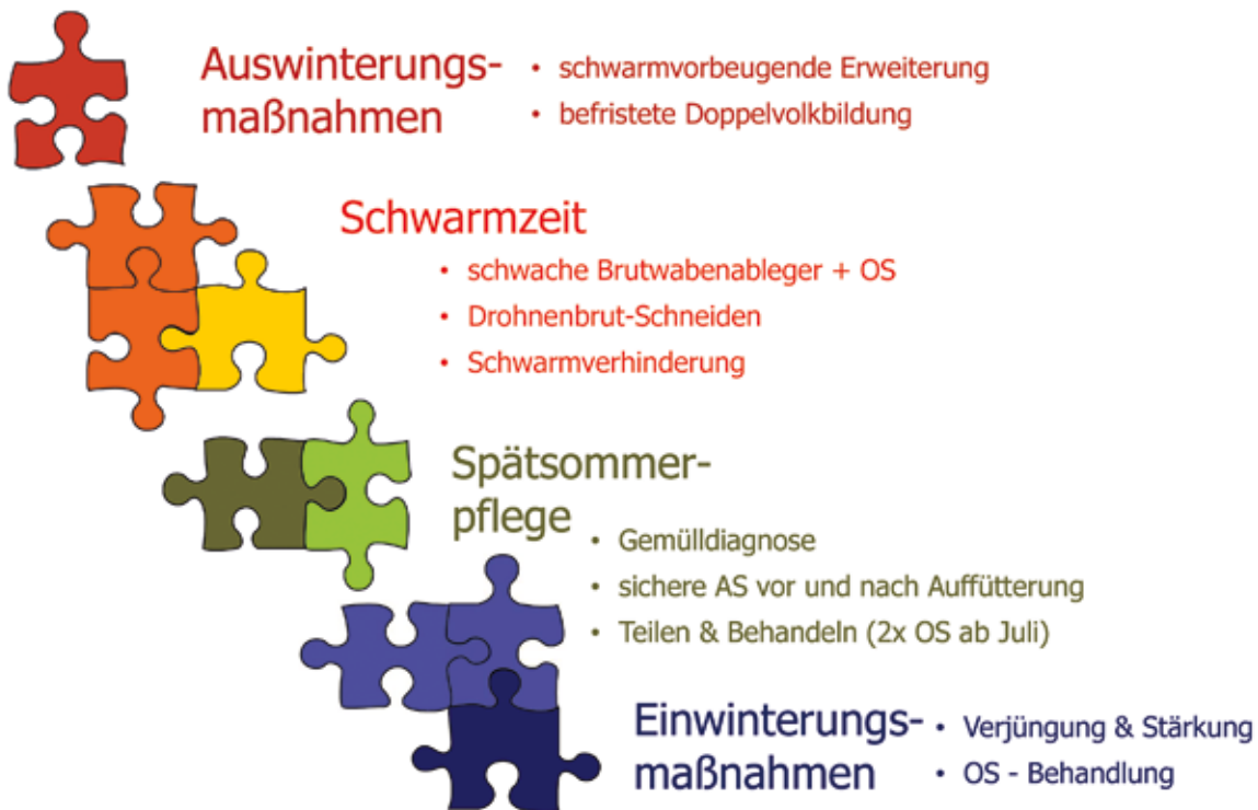
Abb.4 Im BiV-Projekt erarbeiteten die Bieneninstitute Celle und Hohenheim, sowie die Ruhr-Universität Bochum ein einfaches, bienenfreundliches und ökonomisch sinnvolles Konzept für dauerhaft gesunde Völker. Grafik: Dr. Otto Boecking