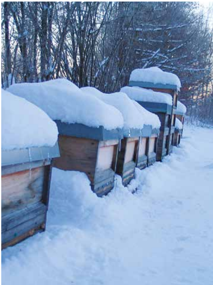
Winteridylle am Bienenstand.

von zu hohen Varroa-Lasten befreit werden, um sie vor dem Ausbruch der Varroose zu bewahren. Prämissen für diese Behandlung sollten sein: kein Einsatz chemischer Mittel während des Eintrags und der Verarbeitung von Honig, kein Einsatz rückstands- oder resistenzbildender Mittel, sowie Berücksichtigung des Tierwohls, also Vermeidung unnötiger Schäden an Bienen, Königin oder Brut. „Ohne Diagnose keine Therapie“, diese Bedingung hat rationalen Therapiekonzepten in der Human- und Tiermedizin sowie der Landwirtschaft zum Durchbruch verholfen. Denn nur wenn Art und Schwere einer Krankheit oder eines Schädlingsbefalls vor Behandlungsbeginn bekannt sind, kann gezielt therapiert und auch der Behandlungserfolg einfach überprüft werden. Wir Imker handeln hingegen oft eher noch wie im Mittelalter: Augen zu und durch.