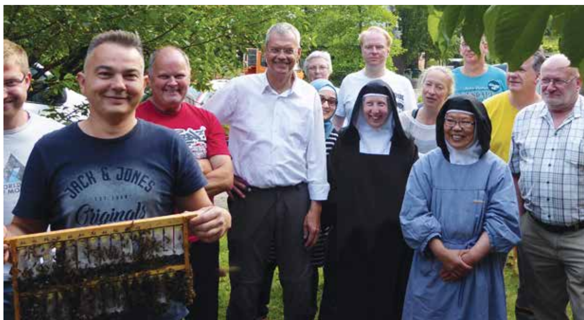
Abb.6 Gewusst wie, klappt die Königinnenvermehrung mit und auch ohne kirchlichen Beistand.