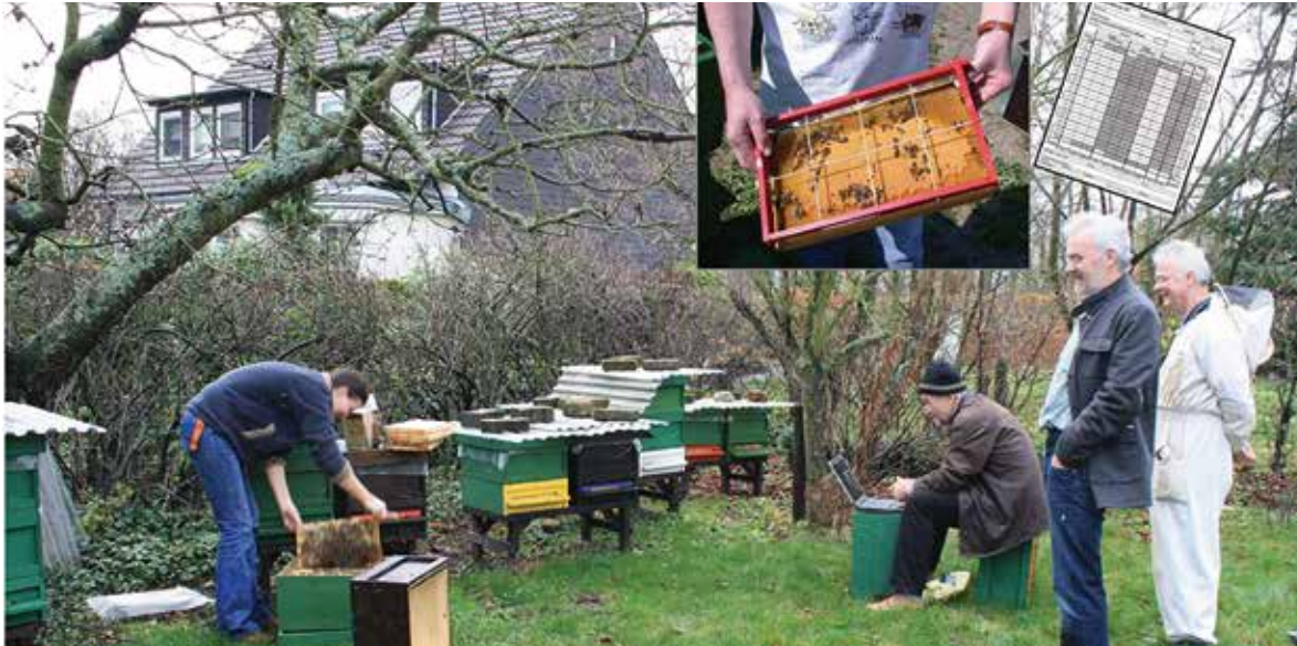
Abb.3 Wissenschaft macht Arbeit: erst nach vielen Jahren und der Beobachtung vieler Völker können definitive Aussagen zu sinnvollen, ökonomischen, tierschutzgerechten Betriebsweisen gemacht werden.

überleben. Unterstützung finden diese medienprominenten Strömungen in vereinzelt Studien, die der aktuell in Deutschland gehaltenen Honigbiene „Überzüchtung“ und damit einhergehenden „Vitalitätsverlust“ bescheinigen.