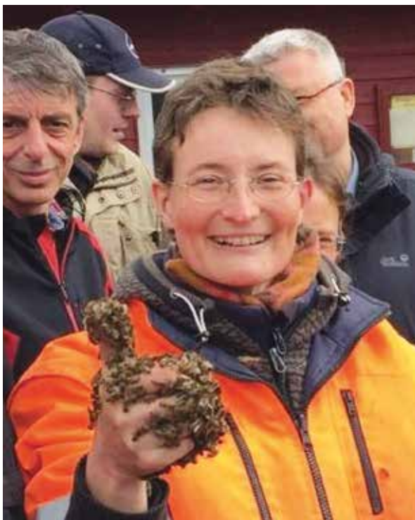
Abb.5 „Bienenhexe“, so die liebevolle Bezeichnung eines erfahrenen Imkers aufgrund meiner penetranten Besservisserei.