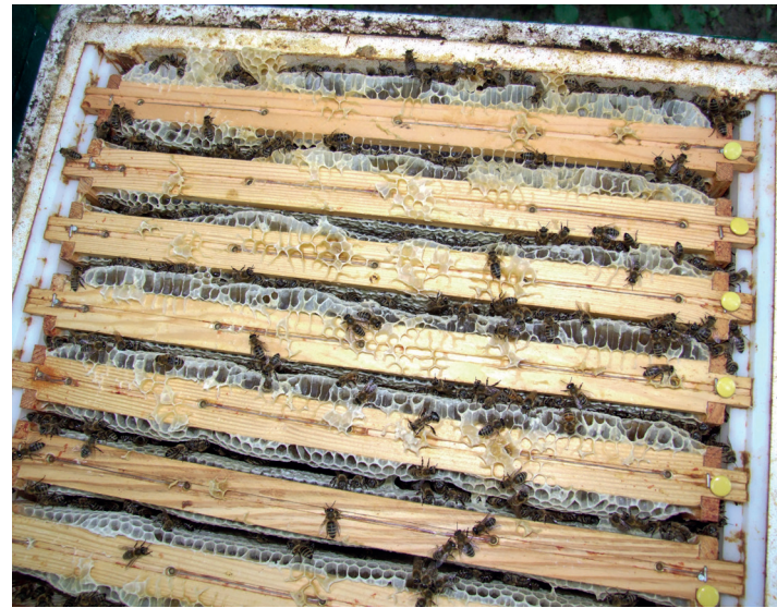
Dieser Honigraum ist verdeckelt und erntereif – die Reißnägel zeigen, dass diese Ernte der vorigen Tracht zuzuordnen ist.

So richtig „Sortenhonig“ ernte ich hier im Berliner Norden nicht. Dennoch versuche ich, die Ernten einigermaßen zu trennen. Daher wird nur geerntet, was wirklich weitgehend verdeckelt ist. Beginn der maßgeblichen