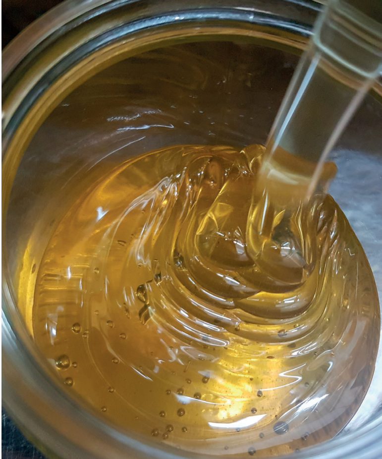
Die erste Ernte im Glas – die Berliner Frühtracht ist besonders intensiv im Geschmack und gut nachgefragt.