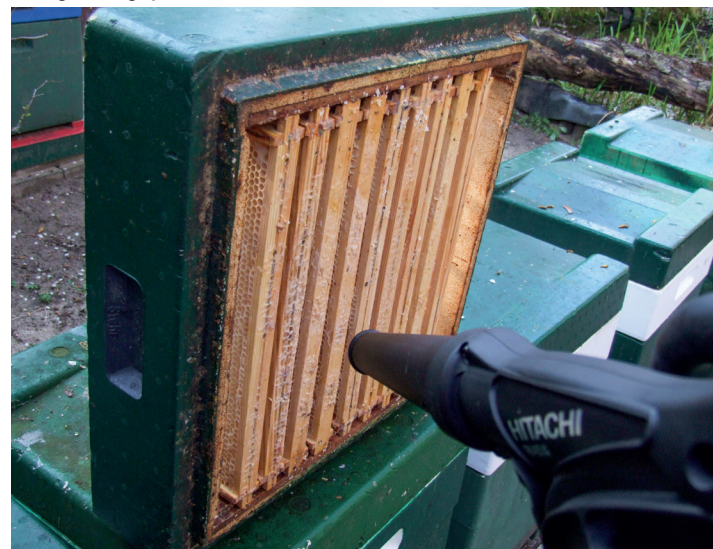
Mit einem Laubbläser werden die letzten Bienen aus dem Honigraum gepustet

Für die Feststellung der Schleuderreife genügt die klassische Spritzprobe: Tropft es noch, wenn die Wabe mit der Öffnung nach unten geschlagen wird, dann ist sie noch nicht schleuderreif. Die Verdeckelung selbst ist zwar ein guter Hinweis, aber kein alleiniges Merkmal: Gerade, wenn die Tracht so richtig brummt, haben die Bienen schlichtweg nicht die Zeit zum Verdeckeln des Honigs. Da gilt es nur aufzupassen, dass die Honigräume früh am Tag mit Bienenfluchten abgegrenzt werden, ehe frischer Nektar eingetragen wird.