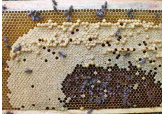
Abb. 4 – Jungköniginnen müssen den Einsatz der Samenblasenklappe manchmal erst üben. Dann verschwinden auch die Buckel.

te sie in der Regel deutlich mehr Zellen bestiften, als die Arbeiterinnen vorbereiten und pflegen können. So werden zwei, drei, vier, fünf Stifte je Zelle abgelegt. Alle sehen intakt, prall und normal groß aus und stehen sauber nebeneinander auf dem Zellboden (Abb.2). Sobald die Larven schlüpfen, betreiben die Ammen Kinder-Kannibalismus und entsorgen alle bis auf eine je Zelle.