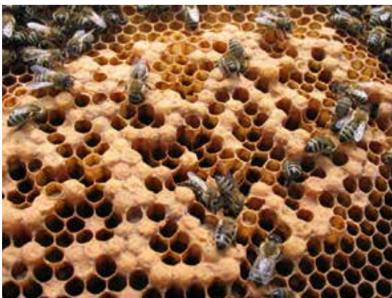
Abb. 5 – Sind Arbeiterinnenzellen buckelig verdeckelt, befindet sich eine buckelbrütige Königin oder, schlimmer, Afterweiseln im Volk.

wenn sie mit einem weiselrichtigen Volk vereinigt werden. Typischerweise erkennt man die Tätigkeit solcher Arbeiterinnen an vielen, auch verschumpelten Stiften, die wild auch an die Zellwand geworfen scheinen (Abb.6). Bis ein Volk allerdings soweit ist, vergeht viel Zeit: das Volk muss erstens hoffnungslos weisellos sein, d.h. keine offene Brut mehr, keine Weiselzellen, keine Jungkönigin vorhanden. Ist dieser Zustand erreicht, vergehen meist nochmal mindestens zwei weitere Wochen. Erst wenn pheromonale Duftstoffe der Königin und Brut solange fehlen, entwickeln sich die Eierstöcke etlicher Arbeitsbienen. Eine sinnvolle Lösung, denn so entstehen „wenigstens“ noch Drohnen, bevor das Volk endgültig untergeht. Ein solches Völkchen wird mindestens 20 m vom Bienenstand entfernt abgeschüttelt, die Waben eingeschmolzen. Noch nicht legende Arbeiterinnen fliegen zurück und betteln sich beim Nachbarn ein. Der Rest kommt „ins Kröpfchen“ von Mäusen und Vögeln.