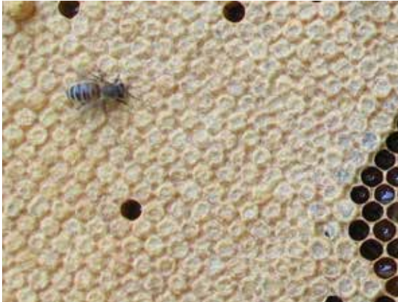
Abb.3 – Flach verdeckelte Arbeiterinnenbrutzellen heißt vollwertige Königin.