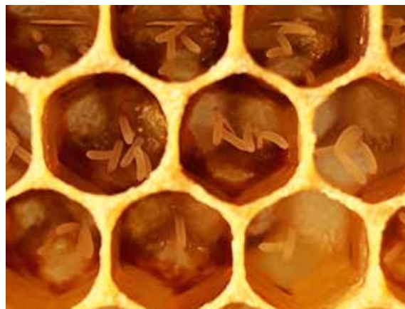
Abb.2 – typische Mehrfachbelegung einzelner Arbeiterinnenzellen von einer übermotivierten Jungkönigin. Wer erwartet bis diese Zellen verdeckelt sind, wird meist beruhigt.