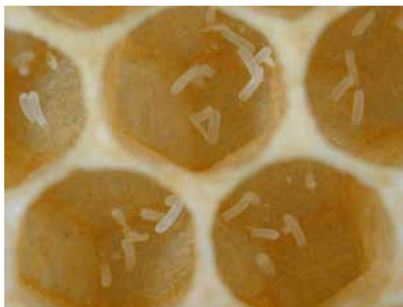
Abb. 6 – Viele verschumpelte Stifte, auch am Zellrand. Vermutlich von Afterweiseln. Für Gewissheit, warte bis zur Verdeckelung.