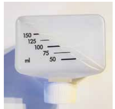
Abb. 21: Die neue Flasche des Liebig-Dispensers mit aufgeklebter Skala.