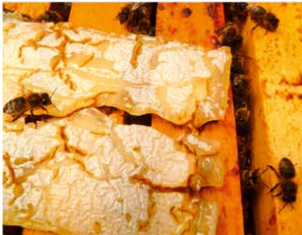
Abb. 19: Nach 3-5 Tagen ist die AS auf jeden Fall verdunstet. Trockenere Streifen in den Müll.