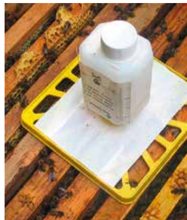
Abb. 16: Einzargige Völker starten immer mit kleinem Docht. Verdunsten nicht mindestens 20 ml (60%ige AS) oder 15ml (85%ige AS im Ausland pro Tag, kann der Docht ja noch vergrößert werden.