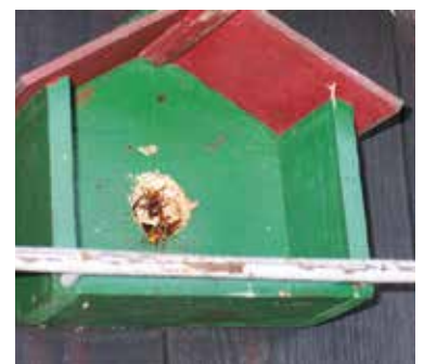
Abb.12: Hornissen leiden oft unter Wohnungsnot. Dieses Hüttchen ist zu klein.

Abschrecken lassen sie sich weder mit angekohltem Kaffeepulver, hübschem Balkonbewuchs aus Basilikum und Tomatenstauden, Duftkerzen, Weihrauch, Lavendel, mit Nelken gespickten Zitronen oder Sprühorgien mit Haarspray. Angeschchnittene Knoblauchzehen wiederum haben tatsächlich bisher alle Vampire von meinem Balkon ferngehalten, den Wespen war dieser angeblich unangenehme Geruch jedoch einerlei. Mit Kleingeld lassen sich Wespen bekämpfen. Allerdings nur, wenn man die geriebene Kupfermünze fest auf eine Wespe aufdrückt, nicht wenn man sie, wie im sommerlichen Informationstief in Funk und Fernsehen neben unbegründeter Panikmache verbreitet, auf