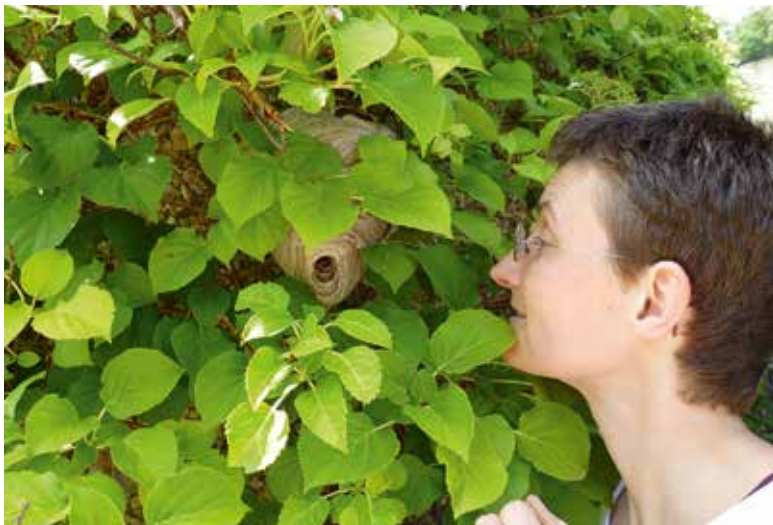
Abb. 7: Freinister hängen lassen. Sie sind nie lästig und interessieren sich nicht für Honigbienen. Nur die Deutsche und die Gemeine Wespe, beides Dunkelhöhlennister, können manchmal am Kaffeetisch oder ungeschützten Bienenvolk lästig werden. Für den Tod von Bienen ist jedoch der Imker verantwortlich.

Unser Nutztier Honigbiene ist ein ökonomisches und ökologisches Erfolgsmodell. Mindestens 160,- Euro pro Volk kann jeder Imker im Mittel alleine durch den Honigverkauf erwirtschaften. Der Wert ihrer Bestäubungstätigkeit ist dagegen nicht mit seriösen Zahlen zu belegen. Je nach Pflanzenart und Landschaftsstruktur reichen die Schätzungen von 0 bis 80% aller bestäubten Blüten. In der Obhut des Menschen bleiben Honigbienen auch in strukturalarmen, intensiv bewirtschafteten Regionen