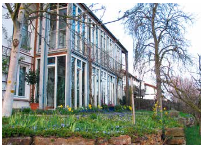
Abb. 5: Obstgehölze, Frühjahrsblüher, Trockensteinmauer...hier herrscht Ordnung und trotzdem ist Platz für Natur.

unserem anspruchsvollen westlichen Konsumverhalten zu machen. Warum nicht zunächst mal vor der eigenen Tür (nicht mehr „kehren“ wie beispielhaft in Abb.5 zu sehen? Schon wenige Dutzend Quadratmeter genügen, um langlebige Hochstämme (Apfel, Birne) zu pflanzen, die bis zu 100 Jahre lang nicht nur bestäubenden Insekten Nahrung, sondern auch Hornissen, Fledermäusen, Käuzen in Höhlen Lebensraum bieten. Die Trockenmauer ist Grundstücksbegrenzung und ökologische Nische zugleich. Wer seine Wiese nicht düngt, sondern nach nur zweimaliger Mahd (Mitte/Ende Juni und Ende August/Anfang September) das Mähgut konsequent abfährt, erhält nach einigen Jahren eine üppige und bunte Blütenvielfalt, die auf den einst überdüngten Flächen keine Überlebenschance hatte. Den Ungeduldigen helfen spezialisierte Gärtnereien bei Auswahl und Wiederansiedlung standorttypischer Pflanzen (wertvolle Pflanztipps und