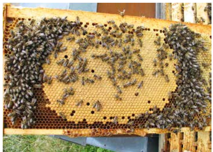
Abb. 14: Große Brutflächen bis an den Oberträger, bewacht von wenig Bienen. So sehen schwach gebildete Jungvölker im August aus. Wer jetzt trotz geringen Befalls mit Ameisensäure behandelt, richtet Schreckliches an.