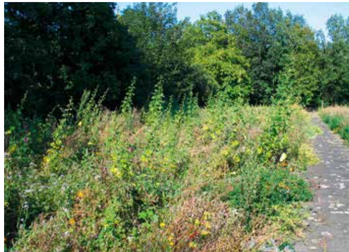
Abb. 6: Tübinger Bienenweidemischung – wirkt unordentlich, ist aber auch nach dem Abblühen noch wertvoll.