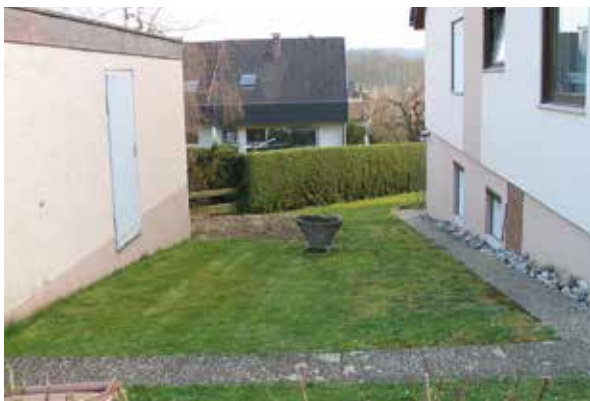
Abb. 3: „Und es ward öd und leer“...in vielen Vorgärten.