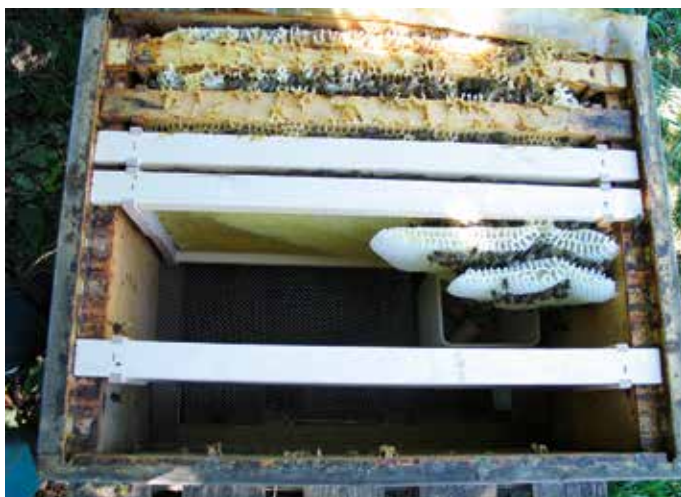
Abb. 13: Drei Fehler auf einen Streich: Neu auszubauende Mittelwände sollten stets einzeln an den Rand des Brutnestes und VOR die Futterwabe geschoben werden. Über die äußere mit Futter gefüllte Wabe steigt das Volk nämlich nur ungern. Zudem zeigt der Wildbau, dass die neue Mittelwand zu spät eingehängt wurde. Die Brutwabe mit der der Ableger startete (ganz oben an der Zargenwand) wurde außerdem nicht nah genug an die Zargenwand geschoben – jetzt haben die Bienen eine oben dick mit Futter gefüllte Wabe erschaffen. Das erschwert die weitere Bearbeitung des Volkes

Die Gründe, deretwegen Menschen sich in Deutschland für die Imkerei interessieren, scheinen sich in den letzten Jahrzehnten geändert zu haben. Nur wenige sehen heute die Imkerei als Zubrot, drei Viertel meiner jährlich etwa 600 Jungimker geben an, mit ihrem Einstieg einen Beitrag zum Umwelt- und Naturschutz leisten