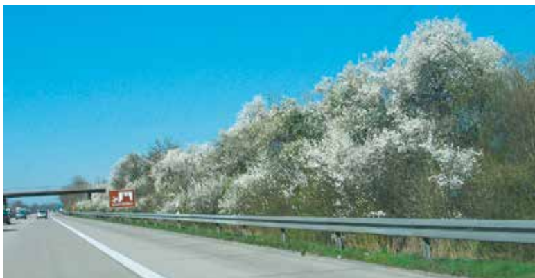
Abb. 4: Autobahnrandstreifen, intelligent mit abwechslungsreichen Gehölzen bepflanzt.

(Türkei). Manch' vor Jahrhunderten eingeschleppte fremdländische Ackerbegleitflora fassen wir inzwischen sogar als so elementaren Bestandteil unserer Kulturlandschaft auf, dass wir ihr Verschwinden im Zuge der Intensivierung der Landwirtschaft heftig beklagen, wie bei Kornrade, Kornblume, Klatschmohn, Ackersenf oder Echter Kamille. Übermächtig werden die „neuen Wilden“ meist nur in instabilen, bereits durch menschliche Eingriffe vorgeschädigten Ökosystemen. Wird z.B. der Bachrand ständig ausgemäht und so „sauber gehalten“, schafft dies optimale Bedingungen für die schnellwüchsigen Fremden Springkraut und Herkulesstaude. Ließe man die Natur walten, verschwänden diese Monokulturen meist auch wieder. Dennoch sollten umsichtige Imker von einer gezielten Verbreitung des weit gereisten Grünzeugs absehen. Dazu zählt aktuell vor allem der als „beste bisher bekannte Spättracht“ beworbene Bienenbaum (Wohlduftrauke,