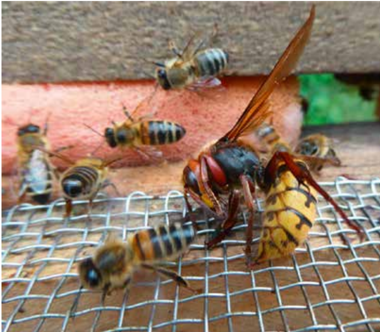
Abb. 9: Dumm gelaufen. Hornissen wagen keinen Schritt ins Bienenvolk. Falls doch, wissen unsere Bienen sich zu helfen. Die wagemutige Hornisse wurde sofort getötet.