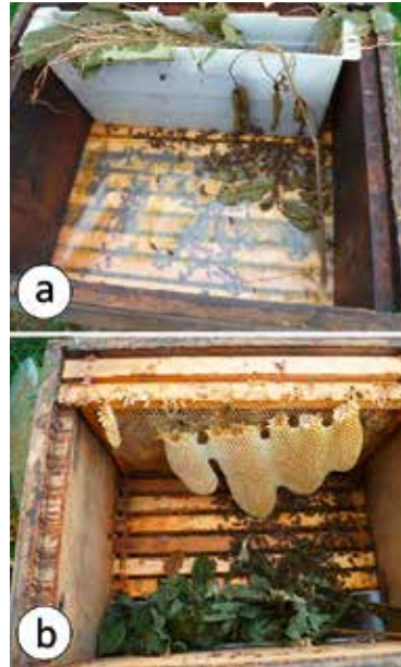
Abb. 15: Fütterung von Jungvölkern klappt am besten mit einer geeigneten Futtertasche. Bei kühlen Temperaturen wird sie neben die Bienenraube gehängt. Achtung, Folie hilft gegen Wildbau.