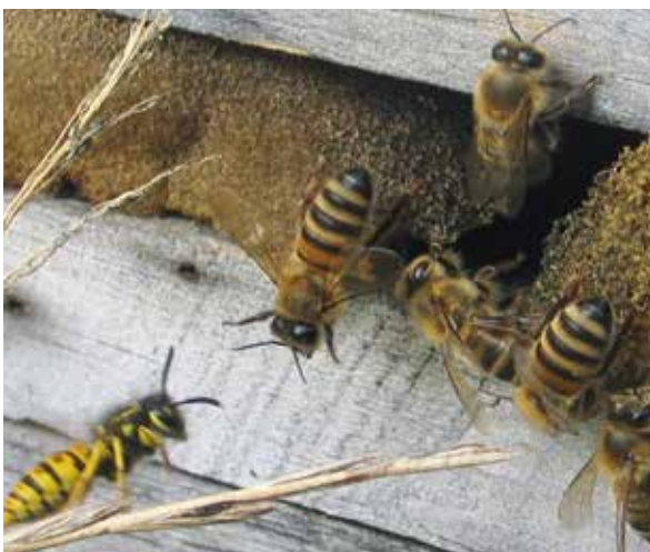
Abb.11 Kleines Flugloch = sichere Verteidigung gegen jeden Räuber.

Alle paar Jahre wieder drangsaliert eine Unzahl von Wespen den friedlichen Gartenbesitzer. Ungebeten sitzen sie mit am Kaffeetisch, beißen vom Grillwürstchen ab und umlagern Fallobst wie Fort Knox. Sogar den stachelbewehrten Bienen gehen diese Gelb-Schwarzen auf den Geist. Ist das Flugloch ab Oktober unbewacht, gehen sie fröhlich ein und aus. „Natürlich ärgere ich mich auch, wenn Hornissen oder Wespen zur Plage werden“ und „Verirrt sich einmal eine Hornissenkönigin in der Wespenfalle, ist das keine Umweltsünde...“ so die