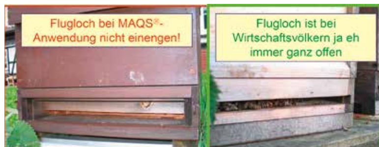
Abb. 17: Beim Einsatz von MAQS-Ameisensäurestreifen muss das Flugloch immer ganz geöffnet sein. Das bedeutet: Jungvölker können auf keinen Fall damit behandelt werden!