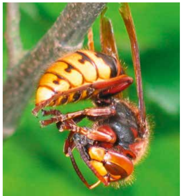
Abb. 8: Vor allem Fliegen stehen auf dem Speiseplan von Hornissen. Ein Hornissenstaat konsumiert zum Höhepunkt seiner Entwicklung im August, September täglich bis zu einem Pfund Insekten, darunter v.a. Fliegen und die (uns lästige) kleinere Verwandtschaft, Deutsche und Gemeine Wespe.