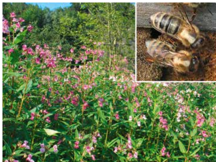
Abb. 2: Schicke Ralleystreifen erhalten die Bienen ab Juli beim Besuch des Drüsiges Springkrauts. Es ist eine gute Bienenweidepflanze, sollte aber nicht gezielt verbreitet werden.