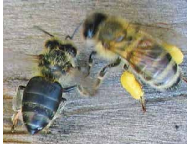
Abb.10: Läderte Flügel, haarlos, schwarz (links) und im aufgeregten Zickzack-Flug unterwegs, typisch für eine räubernde Honigbiene. Unabhängig davon, auf wie vielen kg Vorrat sie bereits zu Hause sitzen, entwickeln Honigbienen auf Jagd nach Wintervorrat eine unschöne Sammelleidenschaft. Einzelne Bienen prüfen ständig die Stärke ihrer Nachbarvölker. Falsch geführte Völker werden schnell als „leichte Beute“ ausgemacht. Die ersten Spione berichten im Heimatstock über das gefundene Fressen, innerhalb kürzester Zeit ist am Bienenstand die Hölle los.