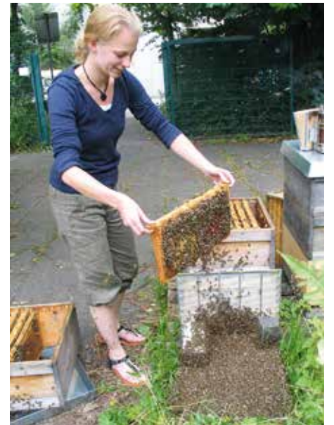
Vereinigung zweier Völkchen: in 9 von 10 Fällen tötet die Fluglochwache die Königin, die über die Rampe eindringen will. 100% sicher ist ein Absperrgitter.