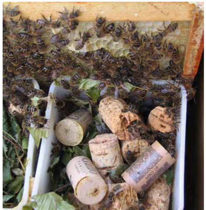
Abb.2: Auch ausrangierte Becher können als Futtereinrichtung dienen.