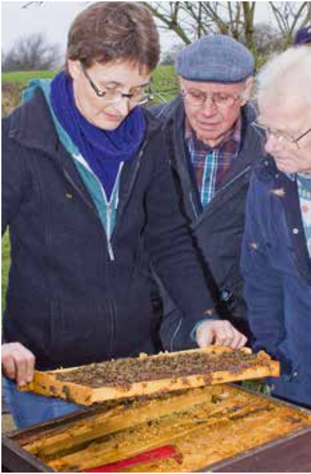
Abb.3 Durchsicht der Völker zwischen Mitte Oktober und Mitte November. Sind Bienenzahl und Futtervorrat o.k.?

(Brut-+ Futterwabe, mit denen sie starteten), alle anderen Waben haben sie im Laufe der letzten 4 Monate aus Mittelwänden selbst gezogen. Die beiden älteren Waben hängen ganz am Rand (vgl. Tipps im Juni und August), dort werden sie im nächsten Jahr selten erneut bebrütet, daher belasse ich sie in den Völkern. Auch die Futterversorgung der Wirtschaftsvölker ist in der Regel bis Anfang Oktober erledigt. Aus Imkerhand und, in Deutschland immer häufiger zu beobachten, Spättrachten aus Balsamine, Senf, Phacelia haben die Völker sich verproviantiert.