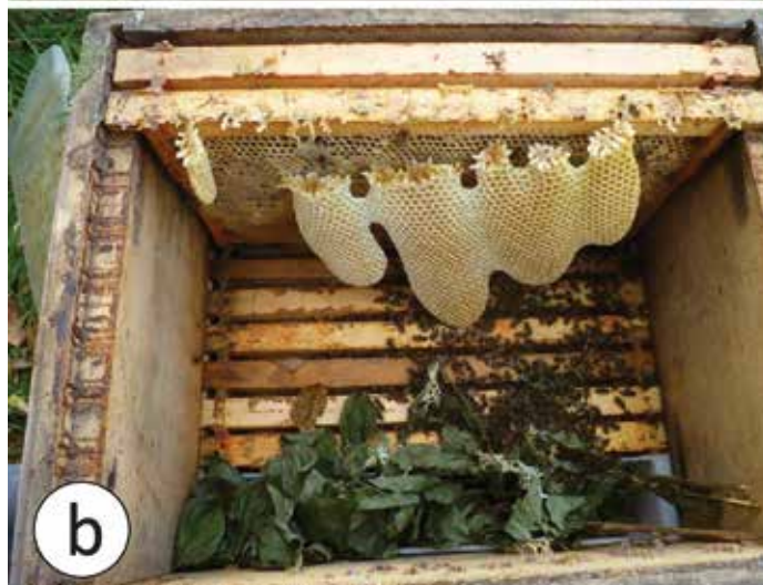
< Abb.1 Jungvölker füttern von oben im September/Oktober (a). Gehen sie nicht dran? Dann Futtertasche in untere Zarge direkt neben Traube hängen. Egal ob oben oder unten: Folie mit Durchschlupf nicht vergessen, sonst entsteht Wildbau (b).